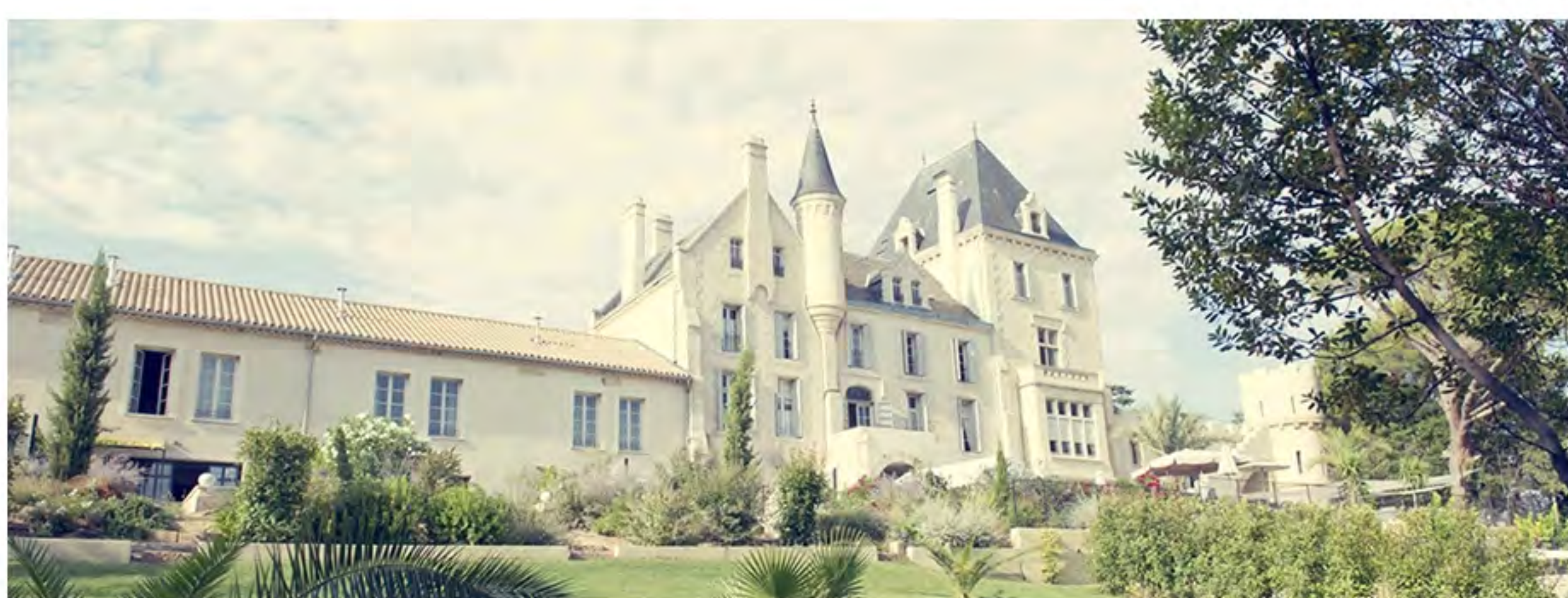
ART DE VIVRE / LE CHATEAU LES CARRASSES