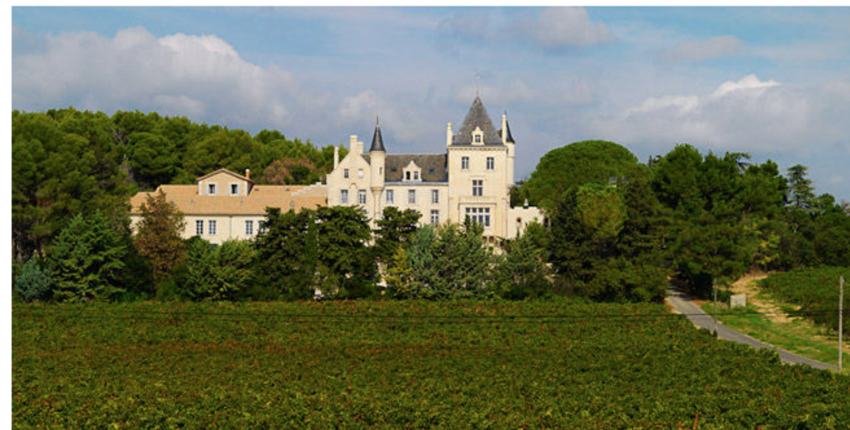
château Les Carrasses

Publié le 27/04/2014 par Romy Ducoulombier