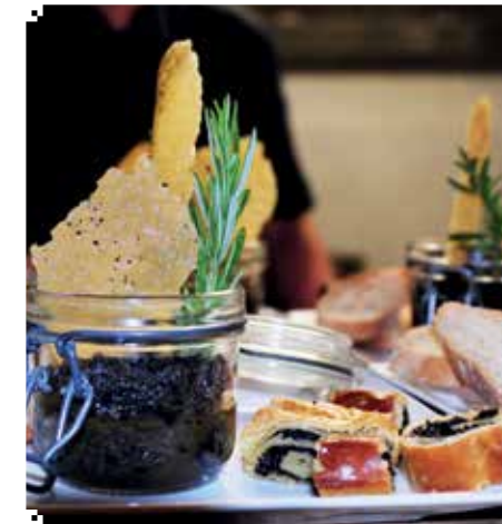
▲ DELIG: Ingen mangel på fristelser her.