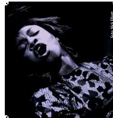
▲ VEGGPRYD: Beverly Knight under konsert.