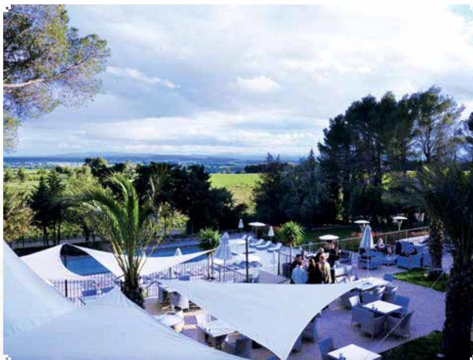
▲ VIVA LA FRANCE: Med utsikt over Languedocs frodige åkrer er det vanskelig å finne et bedre sted for å nyte deilig mat og drikke.