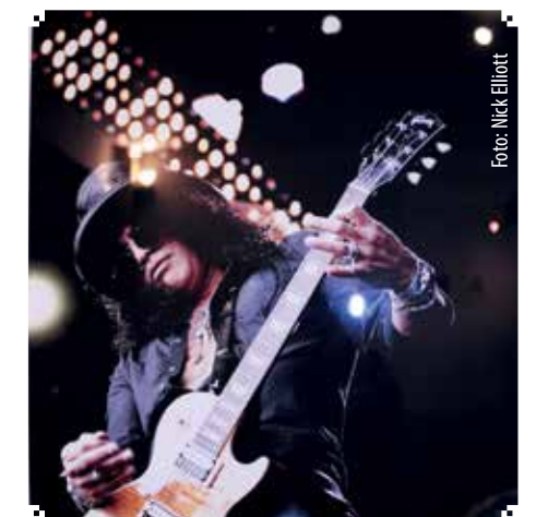
▲ KJENT FJES: Slash fra Guns N' Roses.