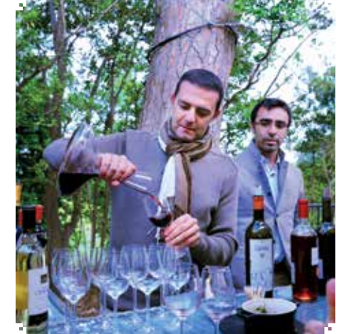
▲ HAGEPARTY: Slottshagen er altfor fin til ikke å bruke til selskapseligheter.

Denis O'Regan slo gjennom med 70-tallets punkbevegelse og har senere fotografert artister som Queen, The Rolling Stones, David Bowie, Duran Duran og Thin Lizzy. Han var også offisiell fotograf ved Live Aid og konserten for Prinsesse Diana.