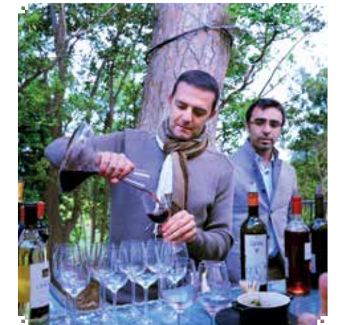
▲ HAGEPARTY: Slottshagen er altfor fin til ikke å bruke til selskapseligheter.