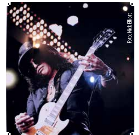
▲ KJENT FJES: Slash fra Guns N' Roses.