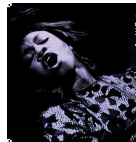
▲ VEGGPRYD: Beverly Knight under konsert.