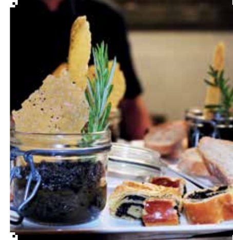
▲ DELIG: Ingen mangel på fristelser her.