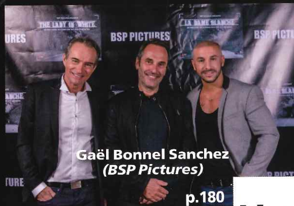
Gaël Bonnel Sanchez (BSP Pictures)